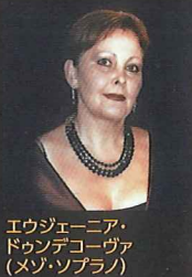
エウゼニア・ドゥンデコーヴァ (メゾ・ソプラノ)