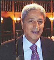
ロマーノ・プッチ (フルート)