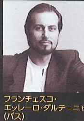
フランチェスコ・エッレーロ・ダルターニャ (バス)