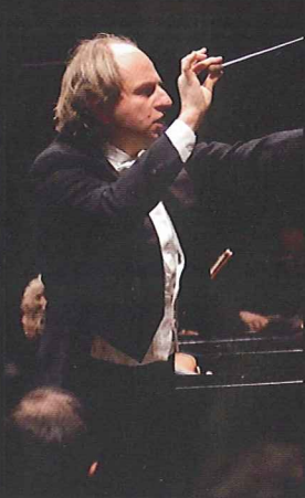
ダニエレ・アジマン (指揮者)